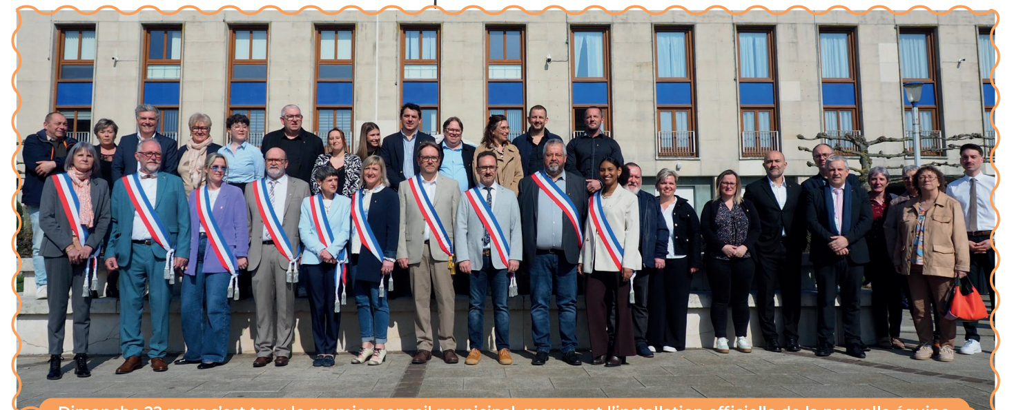
Dimanche 22 mars s'est tenu le premier conseil municipal, marquant l'installation officielle de la nouvelle équipe.

La vie municipale repose sur deux piliers : le conseil municipal et le maire entouré de ses adjoints . Le conseil, composé d'élus, débat et vote les décisions importantes (budget, projets, services...) et soutient le développement local. Le maire et ses adjoints mettent ensuite en œuvre ces décisions et veillent à leur bonne application. Des conseillers délégués peuvent aussi être chargés de missions spécifiques pour suivre certains dossiers. Le fonctionnement est démocratique car tous les élus, y compris d'opposition, participent aux débats et peuvent exprimer leurs points de vue (Un local est d'ailleurs mis à leur disposition). Les décisions sont prises collectivement après discussion et examen des enjeux. Le conseil se réunit au moins une fois par